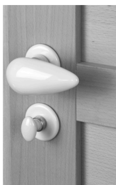
Bouton et poignée de porte