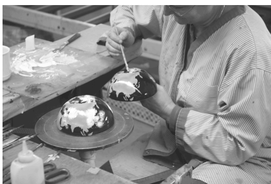
Décoration au pinceau