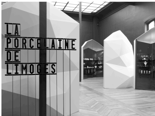
Musée national Adrien Dubouché, Limoges